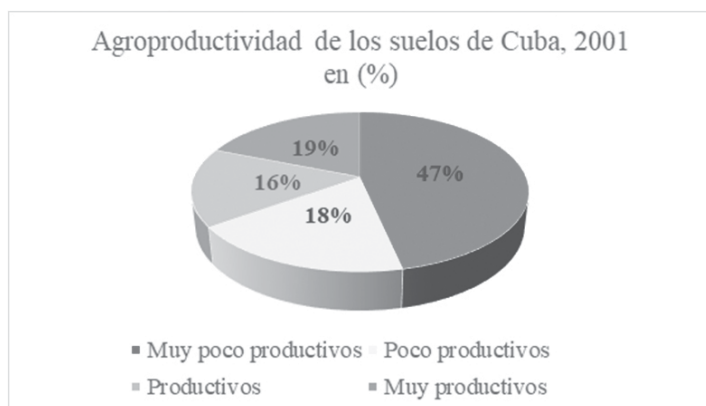
Figura N°3 Agroproductividad de los suelos de Cuba