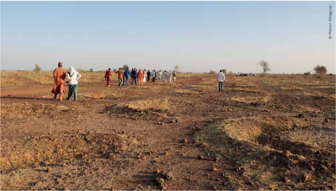
Demi-lunes, restauration d'une zone pastorale, Plateau de Niamba à Torodi, Niger, 2017.

le marché du travail d'ici 2030 en Afrique, dont 65 % seront issus du milieu rural. Vu le peu de perspectives d'emploi et la faible attractivité des conditions de vie en zones rurales, ainsi que la difficulté d'accès au foncier pour les populations locales, l'émigration est souvent perçue comme la seule option possible. Avec 4 milliards de personnes habitant en zone aride d'ici 2050 et une diminution des rendements agricoles de 10 à 50 % selon les régions, 135 millions de personnes risqueraient d'être déplacées du fait de la désertification dans les décennies à venir, 700 millions d'ici 2050 si l'on ajoute les effets de la perte de biodiversité et ceux des changements climatiques. Par ailleurs, les inégalités croissantes, l'accaparement des terres et des ressources pourtant de plus en plus rares, et la coexistence parfois difficile de l'agriculture et du pastoralisme font également de la dégradation des terres une source de conflits .