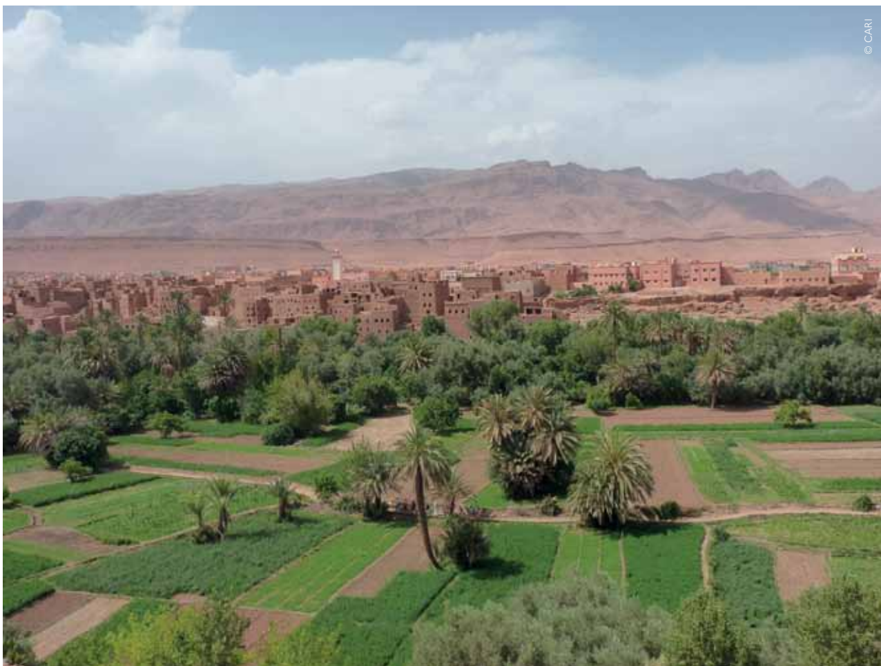
Paysage oasien, Vallée du Dadès, Maroc, 2013.