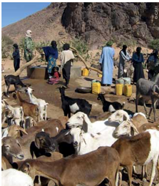
Puits pastoral, Bagzam, Niger, 2007.