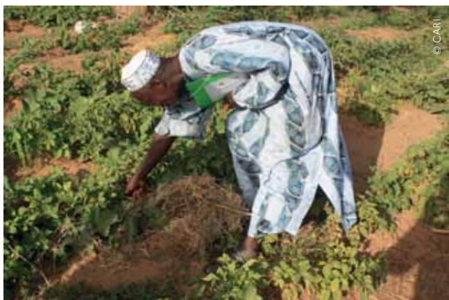
Visite d'un élu local sur un périmètre maraîcher, Sakal, Sénégal, 2017.