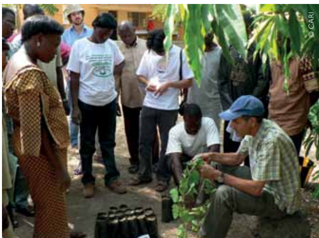
Formation technique de bouturage, Ouagadougou, Burkina Faso, 2007.

4. Promouvoir l' agro-écologie comme un outil de lutte contre la dégradation des terres en documentant ses impacts multidimensionnels (économiques, sociaux, environnementaux, alimentaires et nutritionnels, sanitaires, etc.) ;