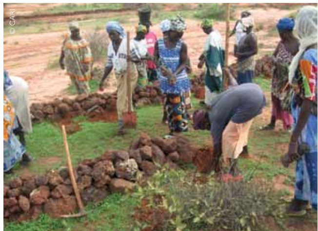
Mobilisation communautaire pour la construction de cordons pierreux, Landou, Mali, 2009.