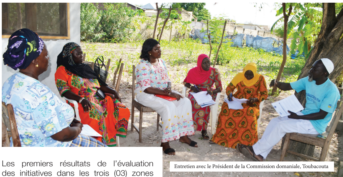
Entretien avec le Président de la Commission domaniale, Toubaouta

De la qualité et de l'équité dans l'accès des femmes à la terre au Sénégal : Quelques leçons tirées des premiers résultats de l'étude de base du projet de recherche-action « Promotion d'une gouvernance foncière inclusive par une amélioration des droits fonciers des femmes au Sénégal »