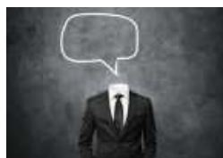
Formação Argumentar e persuadir: desenvolva as suas técnicas