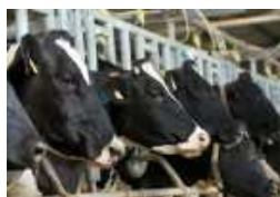
Saúde Animal Ministério da Agricultura diz estar a acompanhar caso...