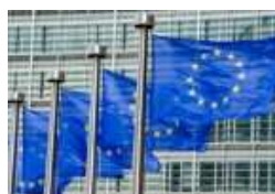
Agroquímicos Estados-Membros querem revisão independente antes de...