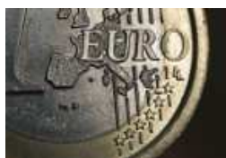
Ajudas Diretas Comissão Europeia reduz ajudas diretas