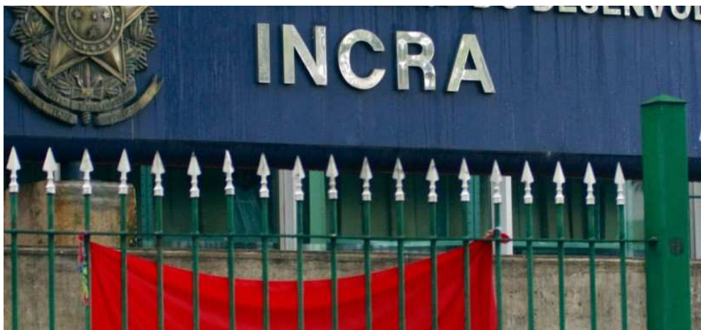
Ex-advogado de ruralistas assume diretoria de terras e assentamento do Incra