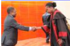
Pr Filipe Nyusi