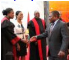
Pr Filipe Nyusi