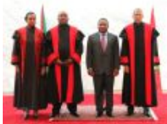
Foto familia do Pr