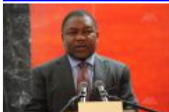
Pr Filipe Nyusi