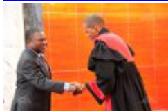
Pr Filipe Nyusi