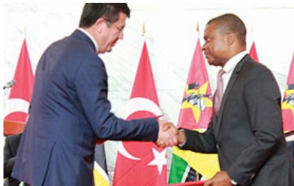
Esta ligação irá abrir o SAPO Fotos.