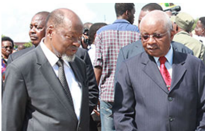
Esta ligação irá abrir o SAPO Fotos.