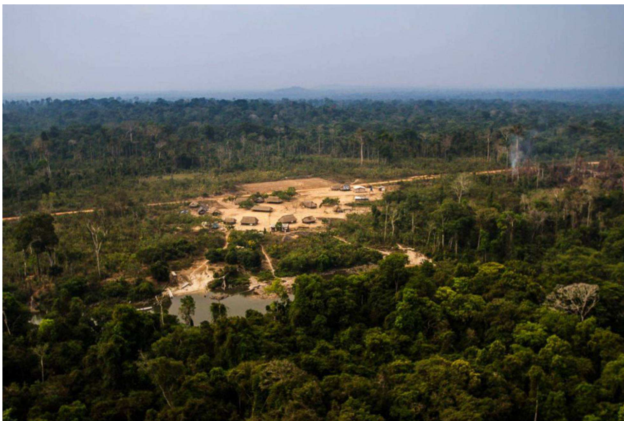
O Instituto Kabu desde 2008 representa as aldeias da TI Mekrãgnoti. Além de atividades de monitoramento, o Instituto apoia ações de preservação da cultura e do território kayapó.

O resultado é que fiscais vão embora, mas grileiros e seus agentes ficam.