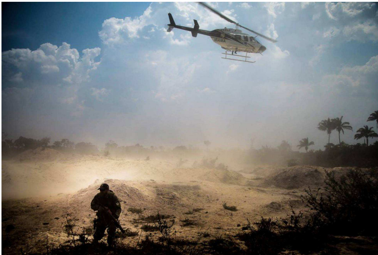
Helicóptero do IBAMA e seus agentes no garimpo Esperança IV.