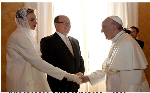
Mundo Vaticano - AS sete mulheres que podem vestir de branco frente ao Papa