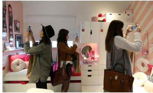
Empresas Vintage: O seu móvel antigo do Ikea pode valer uma fortuna