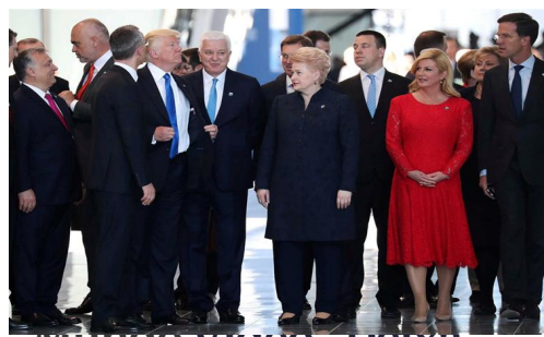
Mundo vídeo - Deixa passar! Trump empurra ministro para chegar à frente na foto...