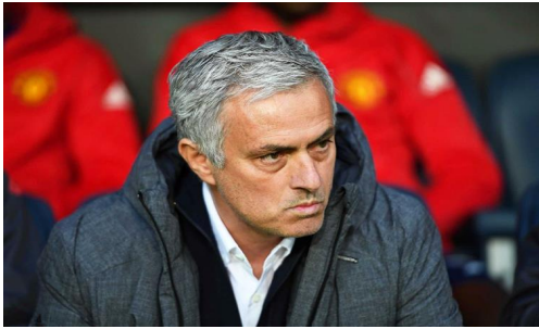
Fotografias O onze de sonho que Mourinho está a preparar para o Manchester United