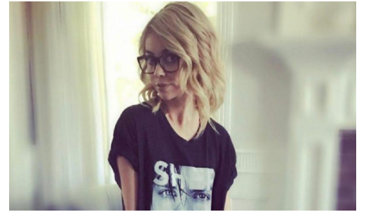
Famosos Sarah Hyland: "Neste momento não controlo a aparência do meu corpo"