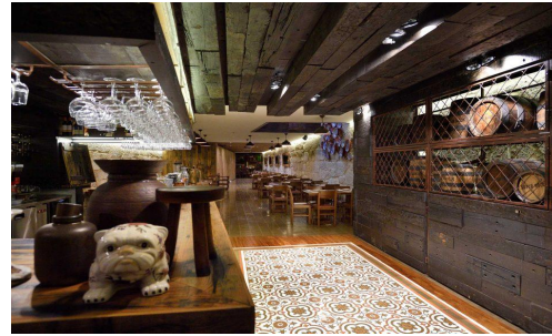
Comer Porto: há uma nova Brasão em rua de francesinhas famosas